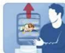
3. Поверните бутылку горлышком вниз