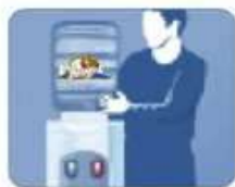
4. Установите бутылку сверху на кулер строго вертикально