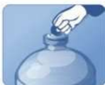
2. Снимите защитный ярлык с пробки