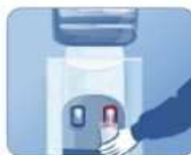
5. Держите кран нажатым, пока не потечет вода