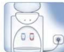
6. Включите кулер в сеть