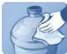
1. Протрите бутылку перед установкой

После хранения аппарата в холодном помещении или после транспортировки при t ниже 0^{\circ}\text{C} , перед подключением к электросети необходимо оставить аппарат на 2-3 часа при комнатной температуре распакованным.